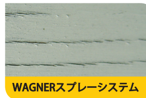
WAGNERスプレーシステム