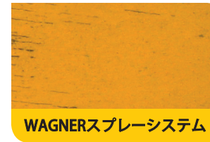
WAGNERスプレーシステム