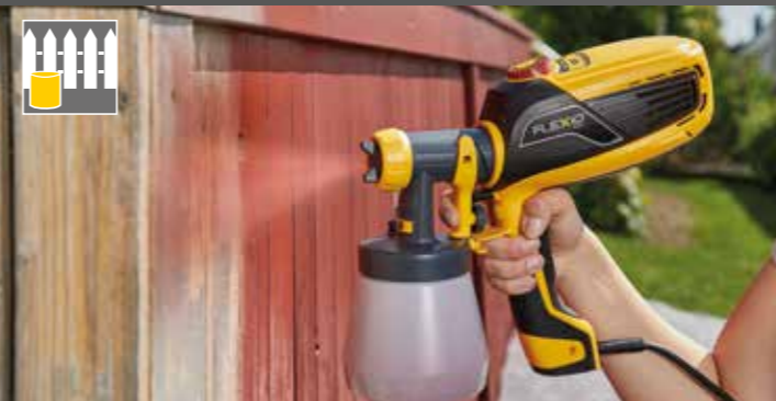
800 ml inserto a spruzzo per verniciare legno e metallo

Quantità d'aria regolabile - per una perfetta spruzzatura di una vasta gamma di materiali.