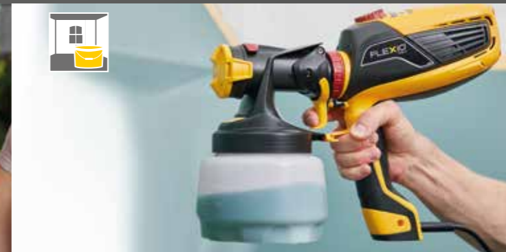
1300 ml inserto per verniciare muri