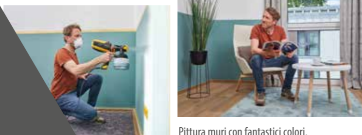
Pittura muri con fantastici colori.