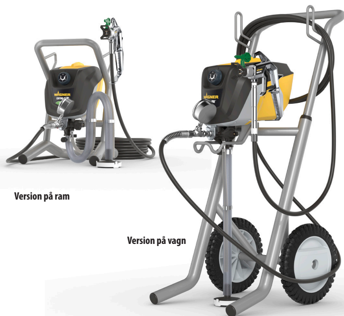
Version på ram