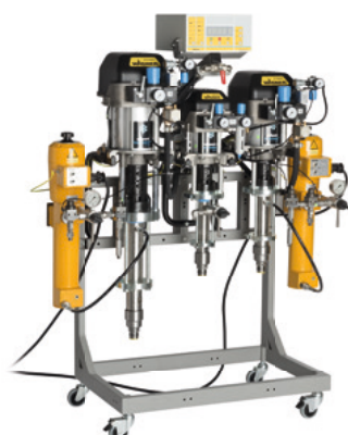
TwinControl 35-70 com aquecedores de material para aplicações AirCoat