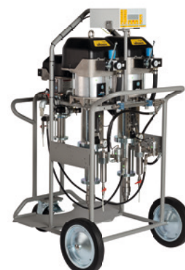
TwinControl 72-200 para proteção pesada corrosiva, montado no carrinho