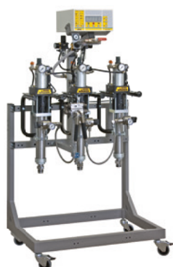
TwinControl 5-60 para aplicações Airspray

O TwinControl pode ser configurado para a sua aplicação.