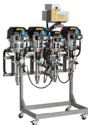
TwinControl 35-70 com extensão para uma segunda cor