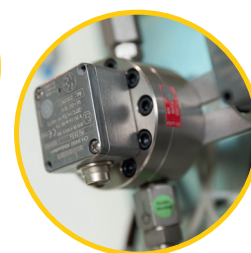
Cella di misurazione della ruota dentata