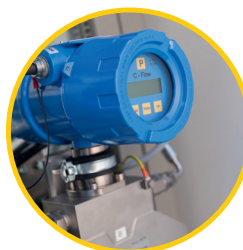
Cella di misurazione della forza di Coriolis