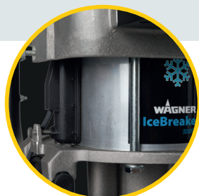
Sensore di corsa WAGNER

L'impianto può essere adattato alle specifiche esigenze del cliente. Viene fornito completamente montato e pronto per essere collegato.