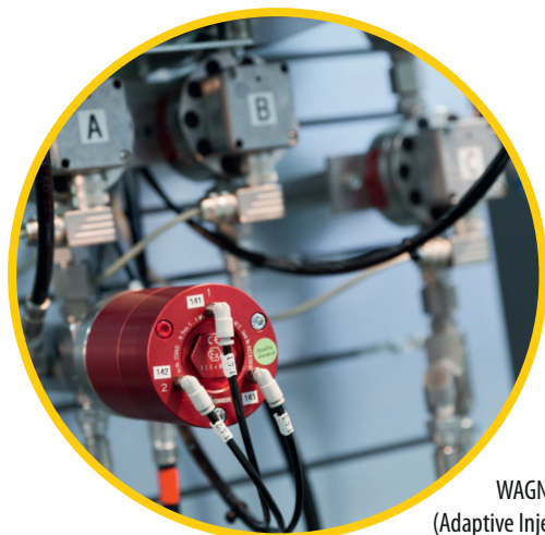
WAGNER AIS (Adaptive Injection System)