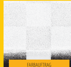
FARBAUFTRAG MIT ROLLE