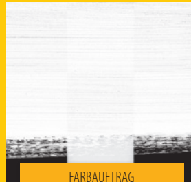
FARBAUFTRAG MIT PINSEL