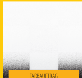
FARBAUFTRAG MIT WAGNER-SPRÜHGERÄT

WAGNER. Die schnelle, saubere und einfache Art Wandfarbe aufzubringen oder zu lackieren.