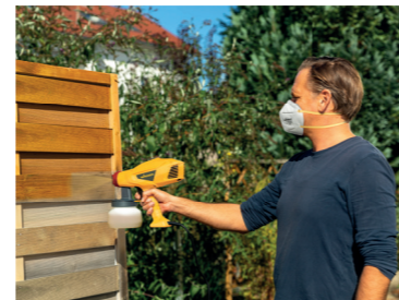
フェンスの木部保護