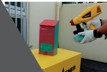
ポストの塗り直し