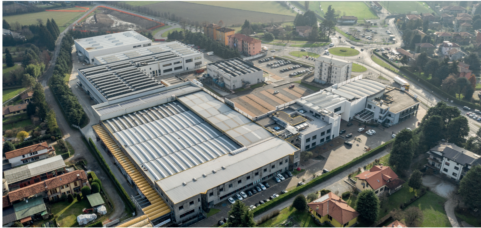
1 - La sede storica di Brianzatende a Lesmo in provincia di Monza e Brianza