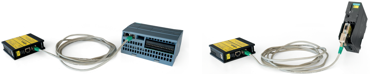
Collegamento a un PLC compatibile con la rete

Il modulo di manutenzione remota WAGNER può essere collegato direttamente ai controllori con interfaccia Ethernet. I controllori con interfaccia MPI possono essere collegati tramite adattatore MPI-Ethernet.