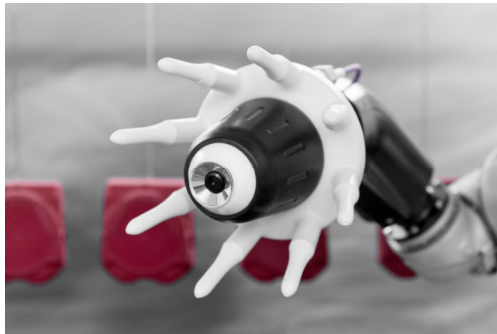
Hochrotationszerstäuber TOPFINISH RobotBell 1 ECH mit Außenaufladung