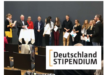
Preisträgerfeier für Stipendiaten