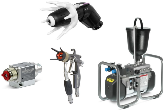
Beispielhaftes Bild der Messe-Exponate im Bereich Nasslackbeschichtung (Förder- und Applikationsequipment)