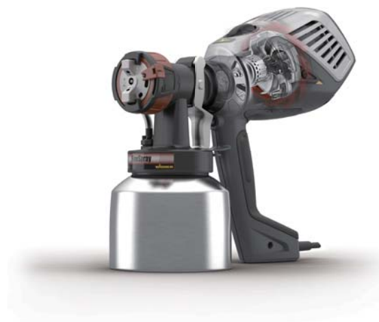
02 - FC 3500 多用途喷涂机 适用于新建和翻新改造小型工程的理想喷涂机