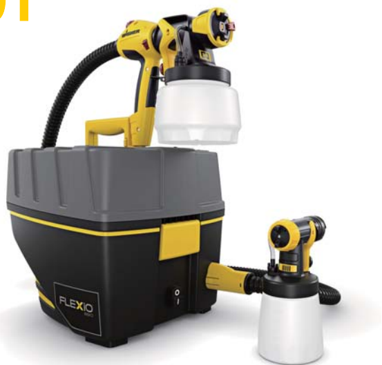
01 - W 890 FLEXiO 通用型喷涂机 适用于小型工程内外墙喷涂的全能型喷涂机